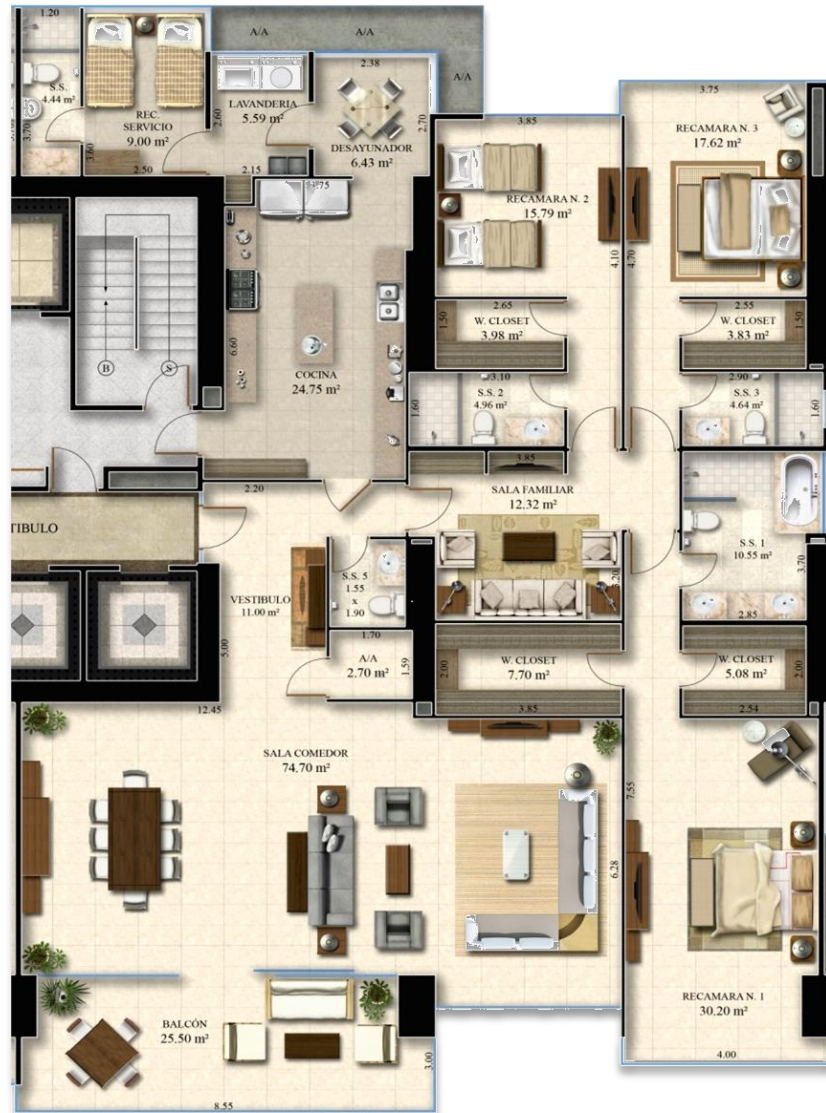
Vista al Mar